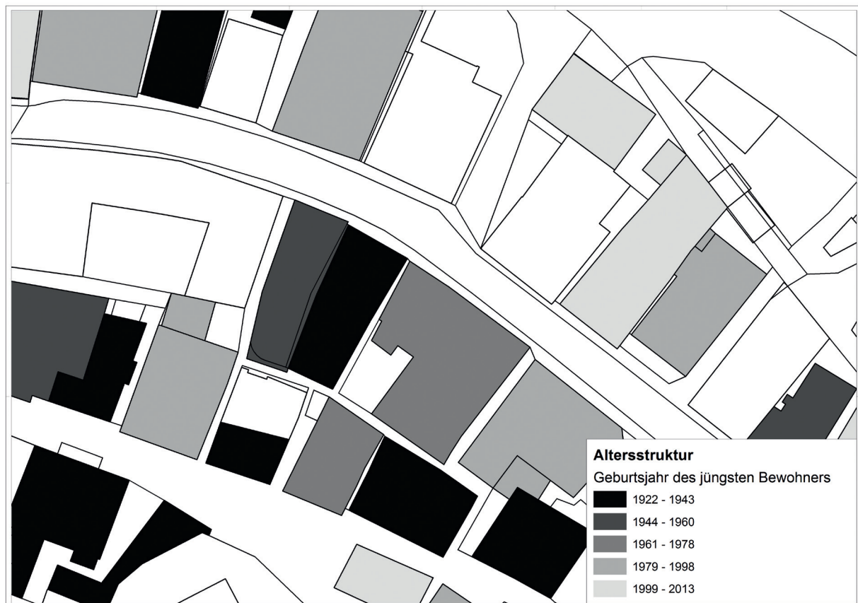
Abb. 2: Exemplarische Darstellung der Altersstruktur in der Bad Bernecker Oberstadt, illustriert anhand des Geburtsjahres des jüngsten Bewohners einer Immobilie.

Ziel des hier entwickelten kommunalen Leerstandsmonitoring ist es erstens, eine regelmäßige (Erfolgs-)Kontrolle durchzuführen. Dazu gehört neben der Pflege der Datenbanken und der Aktualisierung von Daten, z.B. bei einem Eigentümerwechsel, auch die Beobachtung der Leerstandsentwicklung. Hier schließt sich der Kreis zum ersten Schritt, dem Mapping. Die Datenbankpflege erfasst die Wiedernutzung von bisherigen Leerständen;