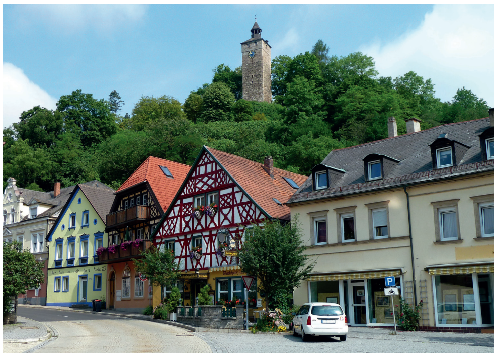
Foto 1: Am Marktplatz in der Oberstadt von Bad Berneck: Zwischengenutzte Leerstände in z. T. historischer Bausubstanz.

Trotz der hier skizzierten Probleme Bad Bernecks, die vor allem in der Oberstadt in Form leerstehender Ladenlokale und Wohnungen deutlich sichtbar werden, ist das touristische Potenzial aufgrund der naturräumlichen Lage im Tal der Ölschnitz sowie der historischen Bausubstanz und der Vielzahl denkmalgeschützter Gebäude durchaus beträchtlich (Foto 1). Dazu sind auch die zahlreichen Leerstände zu zählen. Hier gilt es innovative und kreative Ideen zu entwickeln, um den Ortskern zu revitalisieren und auch in touristischer Hinsicht attraktiv zu gestalten. Grundlegend dafür ist jedoch eine strategische Orientierung, bei der das nachfolgend vorgestellte Leerstandmanagement ein Bestandteil ist.